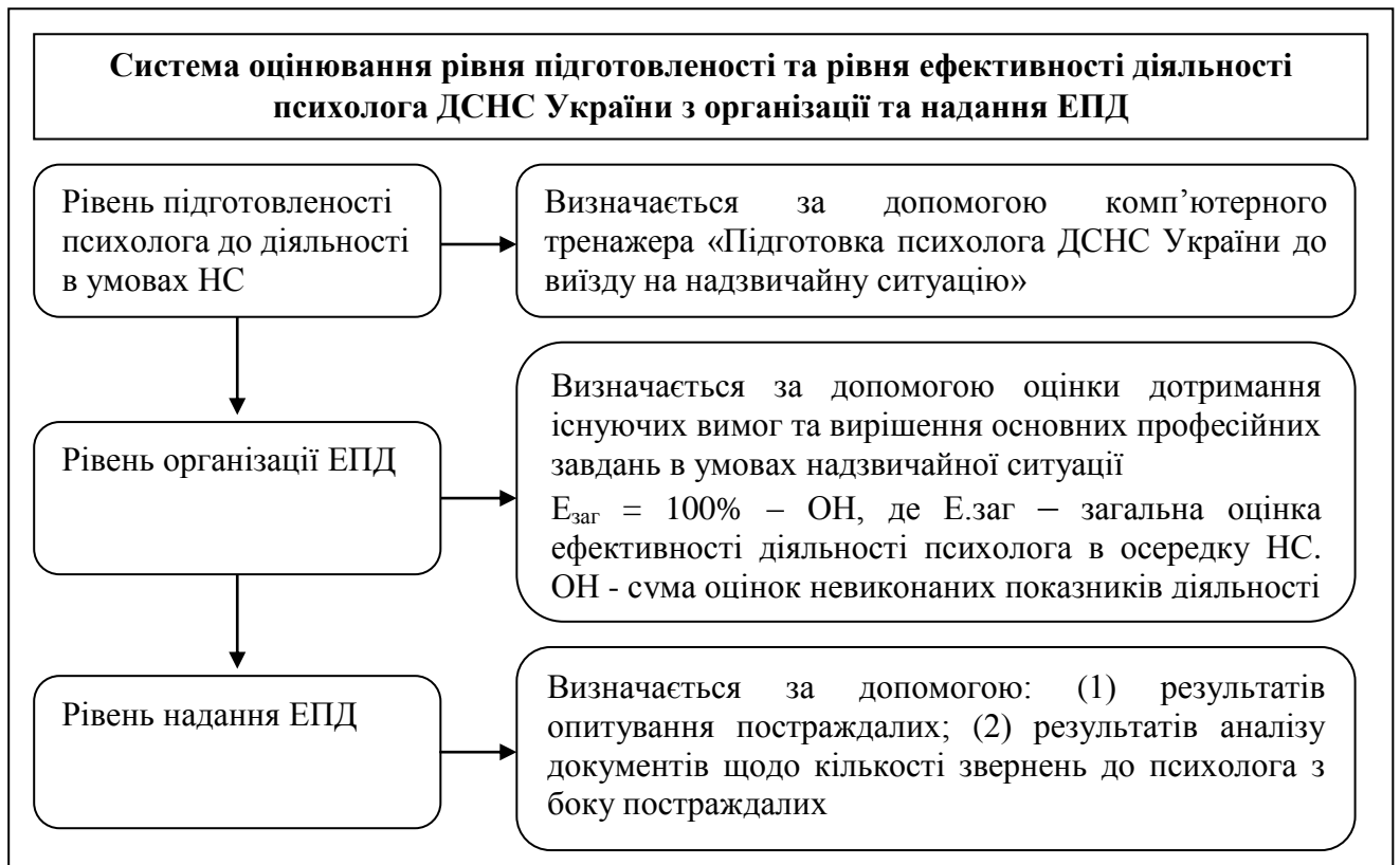
Рисунок 2 - Схема проведення системи оцінювання ефективності діяльності психолога ДСНС України в умовах надзвичайної ситуації

1. Феномен НС на сьогодні не набув єдиного значення в аспекті використовуваних для його характеристики термінів, що ускладнює оформлення чіткої класифікаційної структури цього поняття. Насамперед, не витримується жоден з критеріїв розподілу: в першому випадку акцент ставиться на характеристиці об'єктивних особливостей стимуляції («складні умови»), в другому – на ставленні суб'єкта до цієї стимуляції («важкі умови»), у третьому – на переважному компоненті виниклого стану («стресогенні умови») тощо.